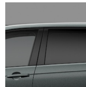
SKLA ZADNÍCH OKEN