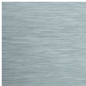
OZDOBNÉ OBLOŽENÍ INTERIÉRU