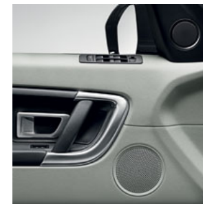
INFORMAČNÍ A ZÁBAVNÍ SYSTÉMY