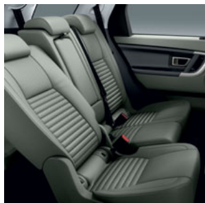
VARIANTY ZADNÍCH SEDADEL