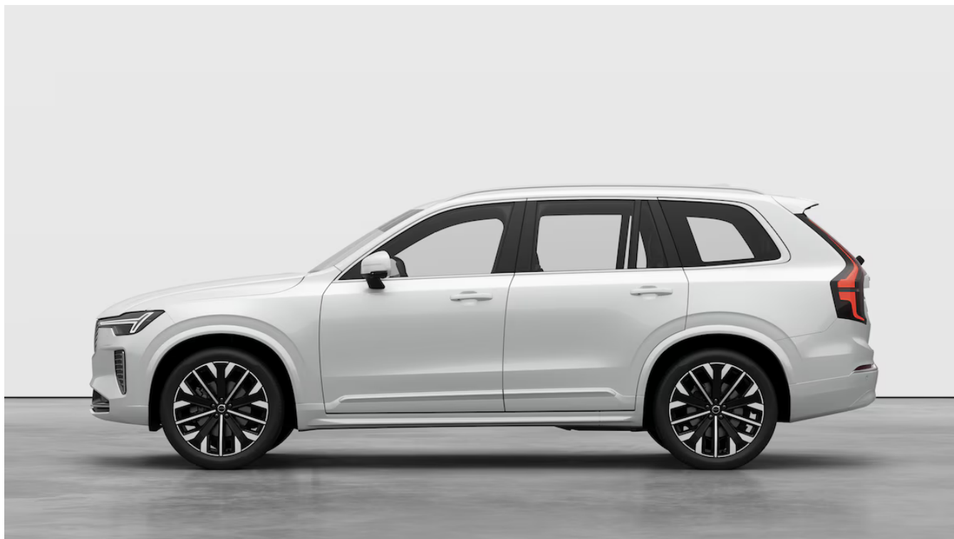
XC90 Bright Plus Exteriér

Pomocí tohoto kódu můžete svůj návrh sdílet s prodejcem Volvo